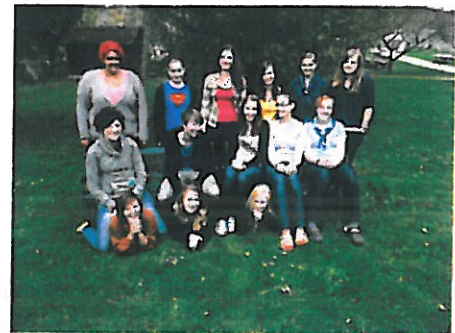
Die waren beim letzten C1-Kurs mit dabei!!